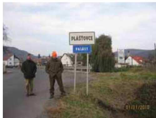
Et par af de trætte unge