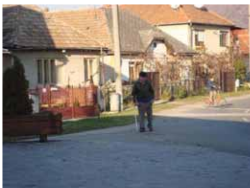
En guide på vej til jægerne. jægere.

Men der var 5 outings endnu, så chancerne måtte jo komme.